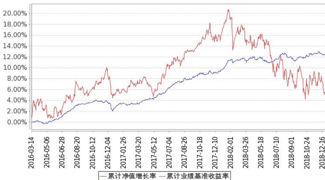
图：嘉实新起航混合基金份额累计净值增长率与同期业绩比较基准收益率的历史走势对比图 (2016年3月14日至2018年12月31日)

注：按基金合同和招募说明书的约定，本基金自基金合同生效日起6个月内为建仓期，建仓期结束时本基金的各项投资比例符合基金合同（十二（二）投资范围和（四）投资限制）的有关约定。