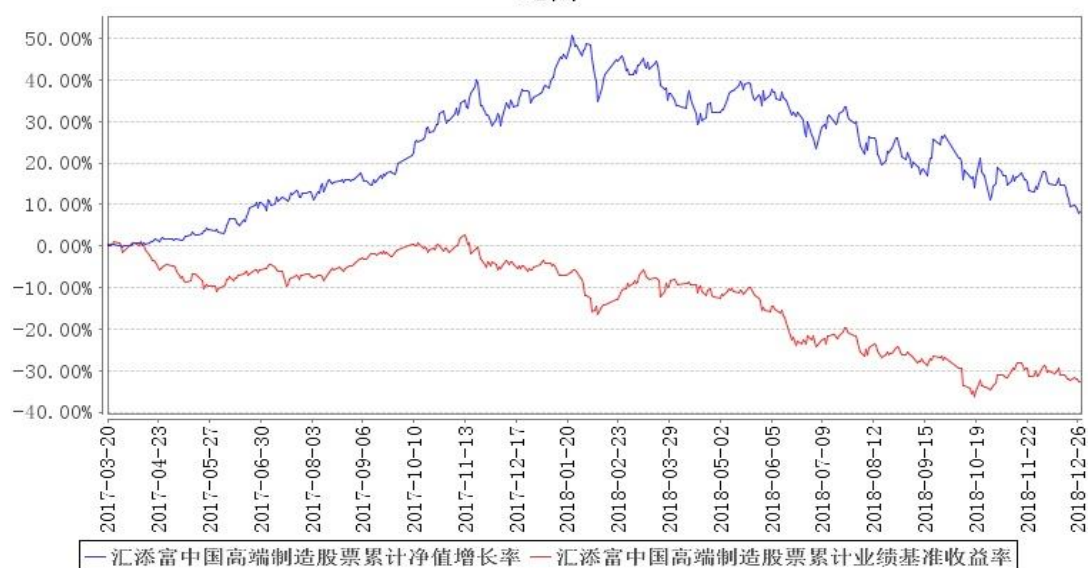
汇添富中国高端制造股票累计净值增长率与同期业绩比较基准收益率的历史走势对比图

注：本基金建仓期为自《基金合同》生效之日（2017年3月20日）起6个月，建仓期结束时各项资产配置比例符合合同规定。