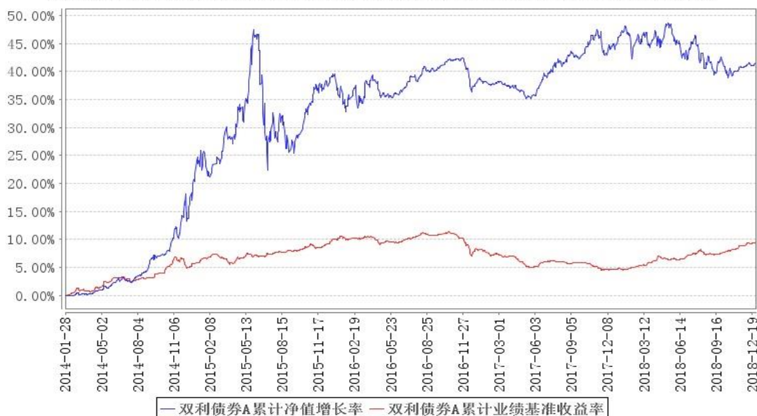
双利债券A累计净值增长率与同期业绩比较基准收益率的历史走势对比图