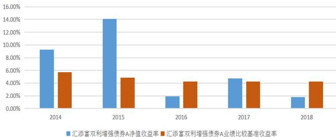
汇添富双利增强债券A基金每年净值增长率与同期业绩比较基准收益率的对比图