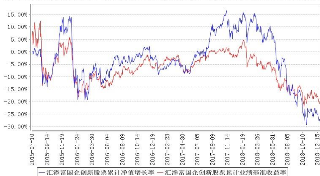
汇添富国企创新股票累计净值增长率与同期业绩比较基准收益率的历史走势对比图

注:本基金建仓期为本《基金合同》生效之日(2015年7月10日)起6个月,建仓期结束时各项资产配置比例符合合同规定。