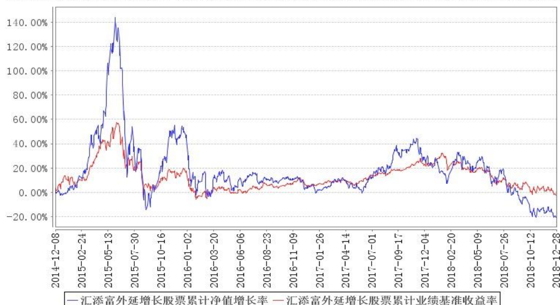
汇添富外延增长股票累计净值增长率与同期业绩比较基准收益率的历史走势对比图

注:本基金建仓期为本《基金合同》生效之日(2014年12月08日)起6个月,建仓期结束时各项资产配置比例符合合同规定。