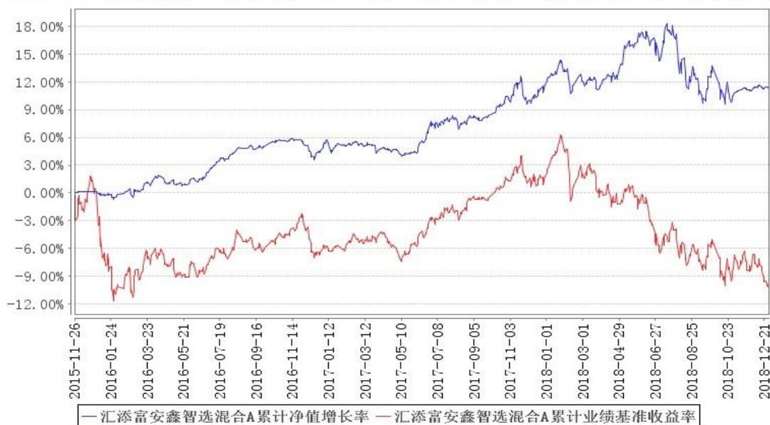
汇添富安鑫智选混合A累计净值增长率与同期业绩比较基准收益率的历史走势对比图