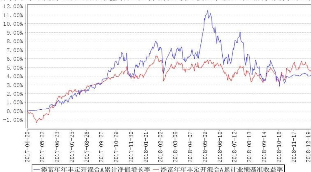
添富年年丰定开混合A累计净值增长率与同期业绩比较基准收益率的历史走势对比图