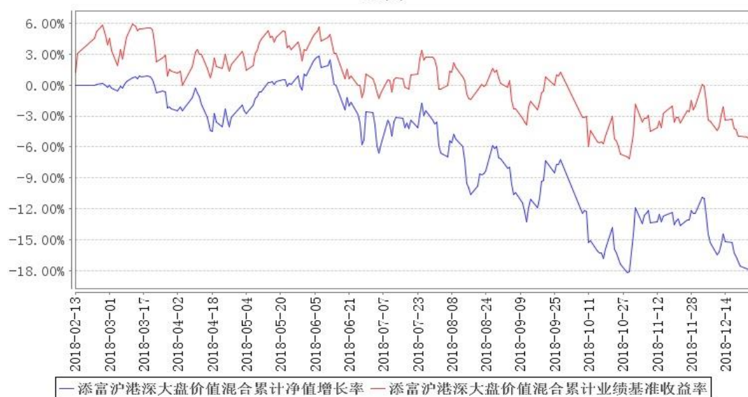
添富沪港深大盘价值混合累计净值增长率与同期业绩比较基准收益率的历史走势对比图

注:本《基金合同》生效之日为 2018 年 2 月 13 日,截至本报告期末,基金成立未满一年;本基金建仓期为本《基金合同》生效之日(2018 年 2 月 13 日)起 6 个月,建仓期结束时各项资产配置比例符合合同规定。