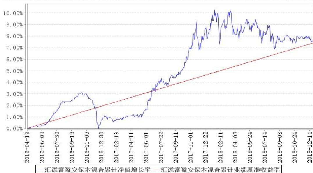
汇添富盈安保本混合累计净值增长率与同期业绩比较基准收益率的历史走势对比图

注：本基金的《基金合同》生效日为 2016 年 4 月 19 日，建仓期结束时各项资产配置比例符合合同规定。