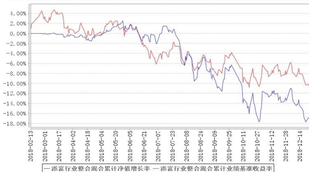
添富行业整合混合累计净值增长率与同期业绩比较基准收益率的历史走势对比图

注：本《基金合同》生效之日为 2018 年 2 月 13 日，截至本报告期末，基金成立未满一年；本基金建仓期为本《基金合同》生效之日（2018 年 2 月 13 日）起 6 个月，建仓期结束时各项资产配置比例符合合同规定。