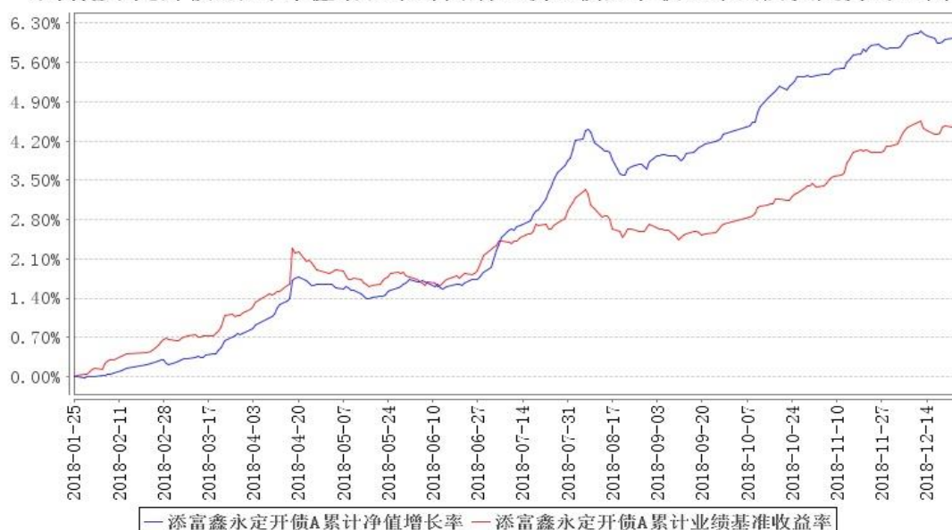
添富鑫永定开债A累计净值增长率与同期业绩比较基准收益率的历史走势对比图