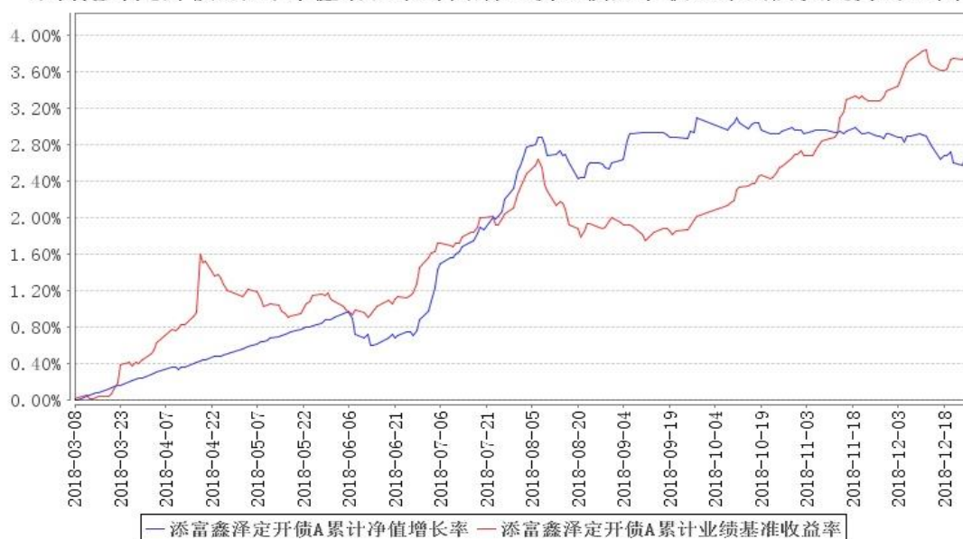
添富鑫泽定开债A累计净值增长率与同期业绩比较基准收益率的历史走势对比图

注:1、本《基金合同》生效之日为 2018 年 3 月 8 日,截至本报告期末,基金成立未满一年;本基金建仓期为本《基金合同》生效之日(2018 年 3 月 8 日)起 6 个月,建仓期结束时各项资产配置比例符合合同规定。