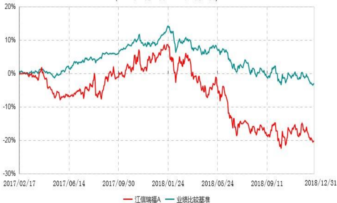
江信瑞福C累计净值增长率与业绩比较基准收益率历史走势对比图