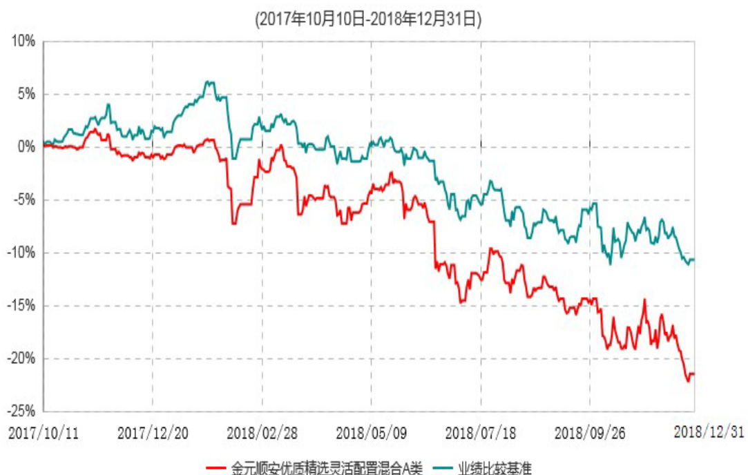
金元顺安优质精选灵活配置混合A类累计净值增长率与业绩比较基准收益率历史走势对比图