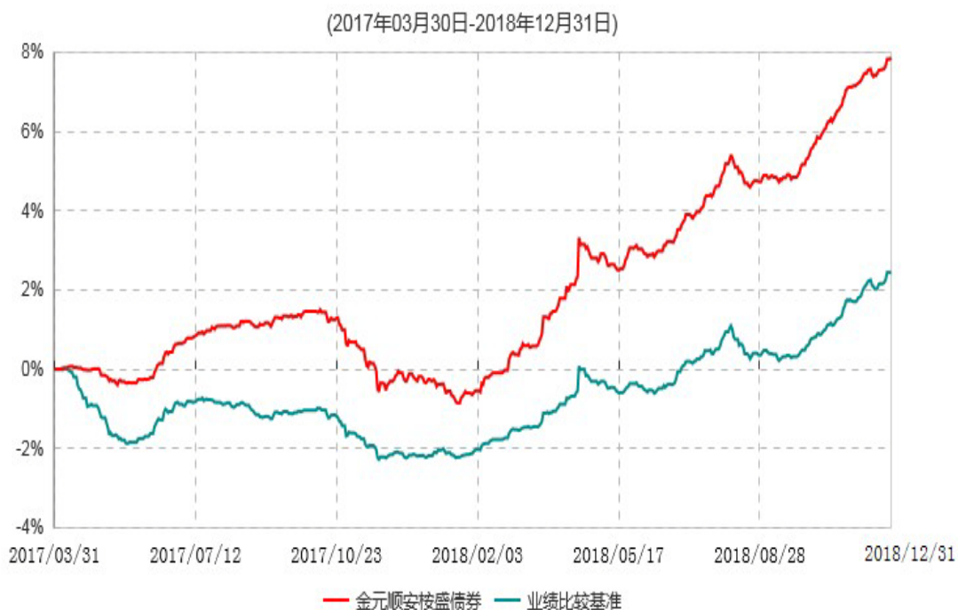
金元顺安桉盛债券型证券投资基金累计净值增长率与业绩比较基准收益率历史走势对比图