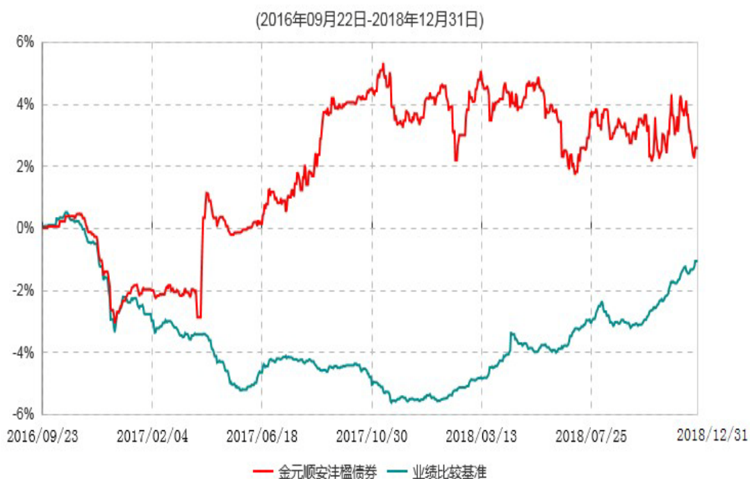
金元顺安沅楹债券型证券投资基金累计净值增长率与业绩比较基准收益率历史走势对比图