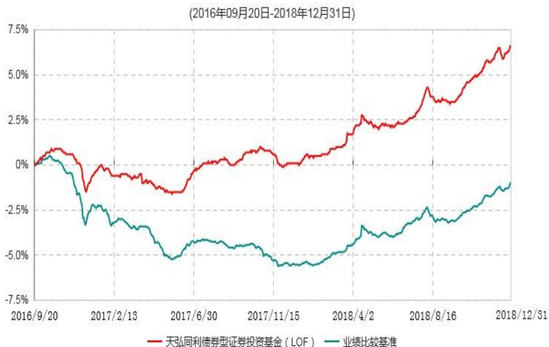
天弘同利债券型证券投资基金（LOF）累计净值增长率与业绩比较基准收益率历史走势对比图