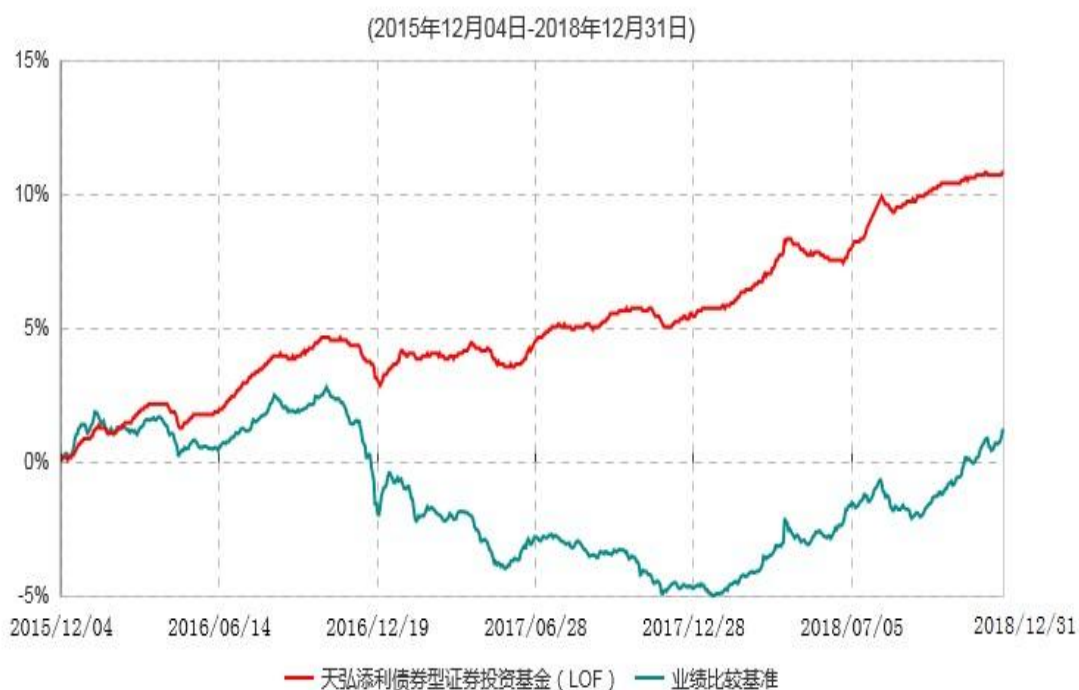
天弘添利债券型证券投资基金（LOF）累计净值增长率与业绩比较基准收益率历史走势对比图