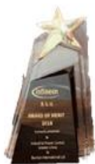
英飞凌 2018 年度 工业功率控制市场杰出表现奖