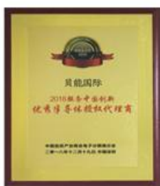
中国创新优秀半导体授权代理商