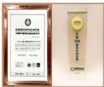
中国 500 最具价值品牌

际电子商情》授予的“十大本土分销商”、英飞凌公司授予的“2018 年度工业功率控制市场杰出表现奖、电源管理及多元化市场深度拓展卓越奖、最佳数据安全解决方案开发奖”、微芯公司授予的“中国区第一代理”等奖项。公司还荣获 CEDA（中国电子元器件授权分销商协会）授予的“2018 服务工业与物联网领域十大授权分销商”、“2018 服务中国创新优秀半导体授权代理商”等荣誉称号。