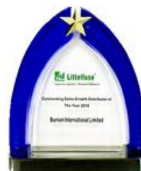
Little fuse 中国区 2018 年度最佳销售成长