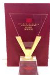
中国上市公司 IPO 新星奖