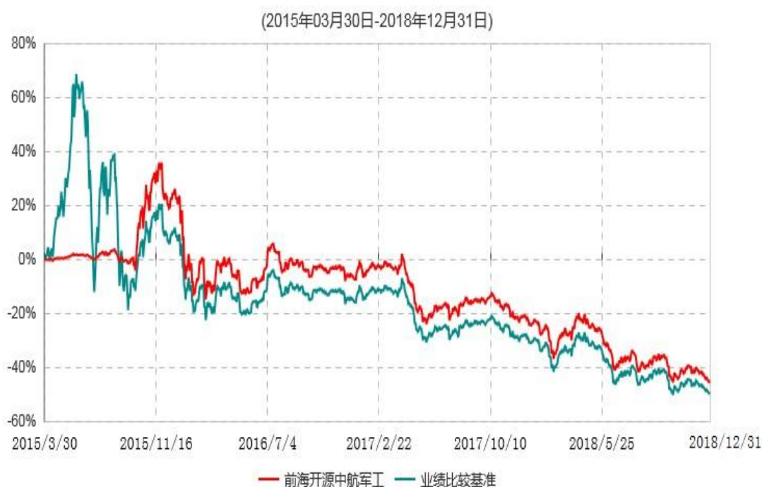
前海开源中航军工指数分级证券投资基金累计净值增长率与业绩比较基准收益率历史走势对比图