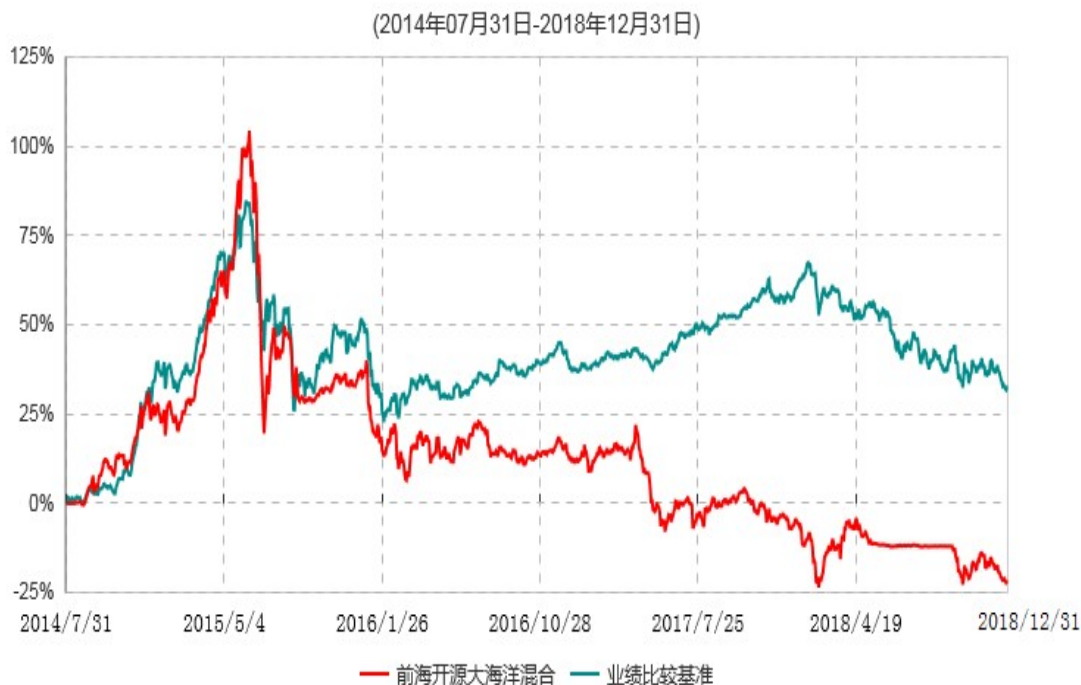
前海开源大海洋战略经济灵活配置混合型证券投资基金累计净值增长率与业绩比较基准收益率历史走势对比图