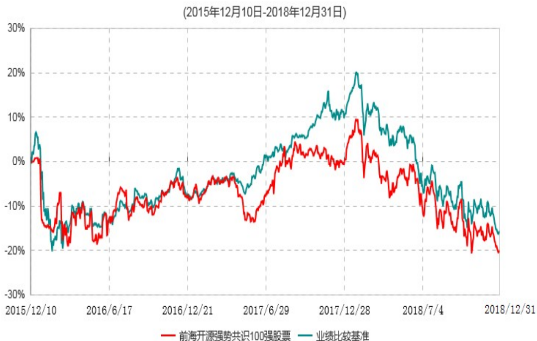
前海开源强势共识100强等权重股票型证券投资基金累计净值增长率与业绩比较基准收益率历史走势对比图