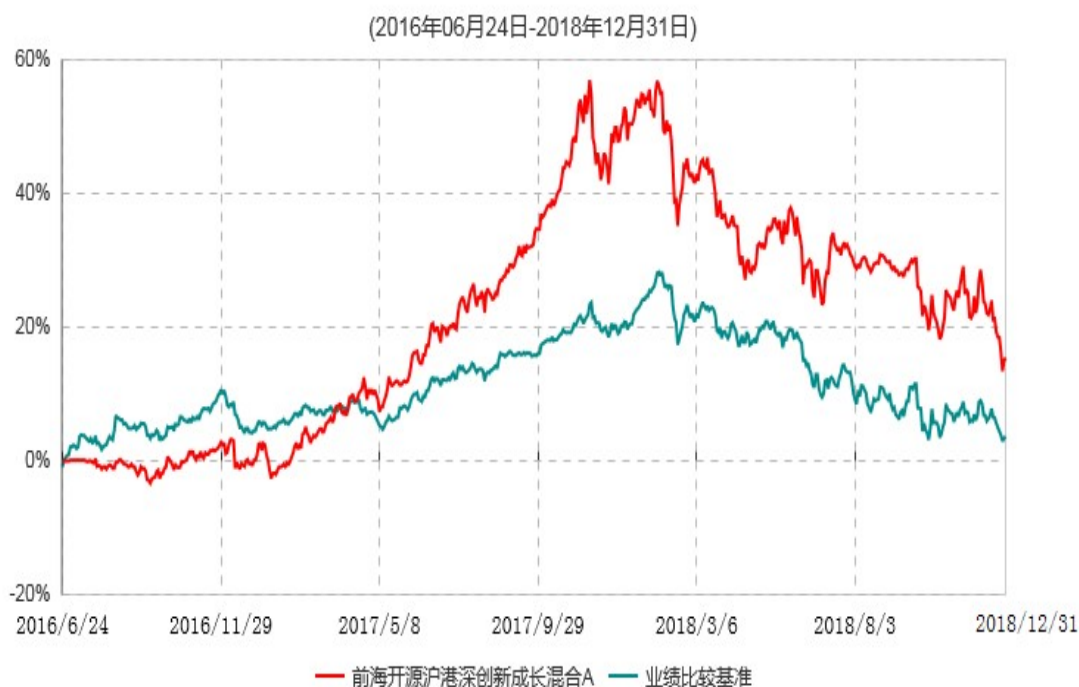
前海开源沪港深创新成长混合A累计净值增长率与业绩比较基准收益率历史走势对比图