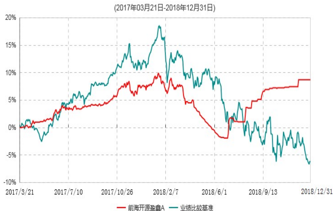
前海开源盈鑫A累计净值增长率与业绩比较基准收益率历史走势对比图