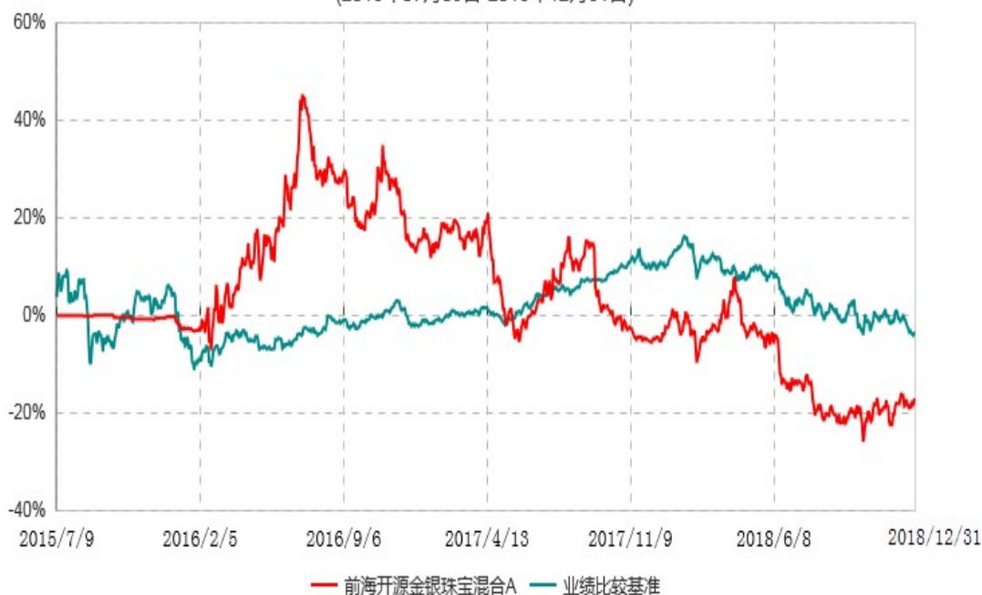
前海开源金银珠宝混合C累计净值增长率与业绩比较基准收益率历史走势对比图