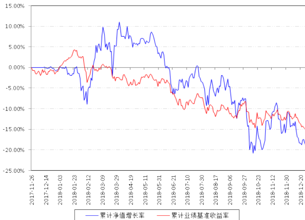
南方互联网+灵活配置混合累计净值增长率与同期业绩比较基准收益率的历史走势对比图