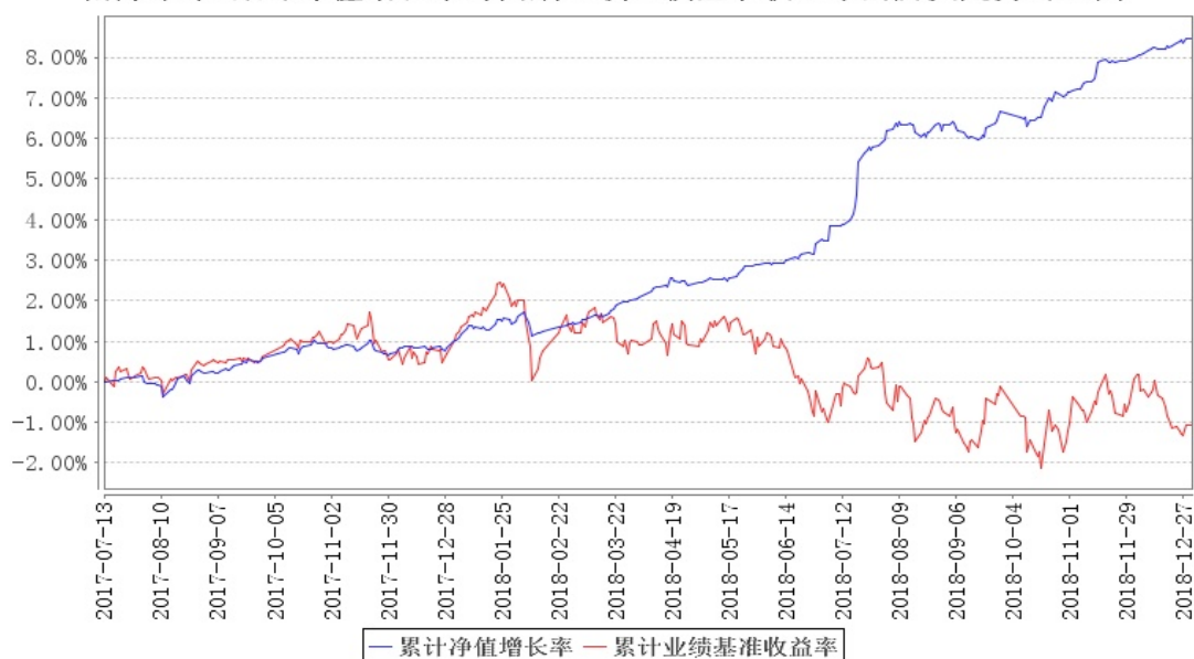
南方荣年A累计净值增长率与同期业绩比较基准收益率的历史走势对比图