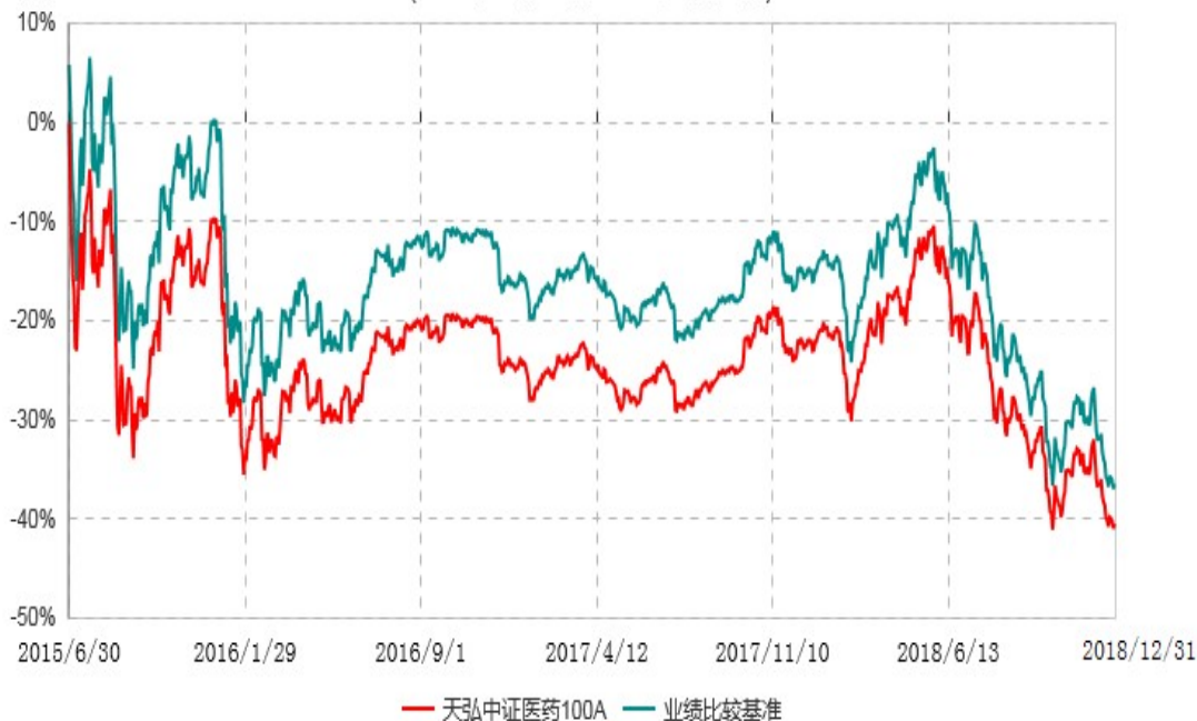
天弘中证医药100C累计净值增长率与业绩比较基准收益率历史走势对比图