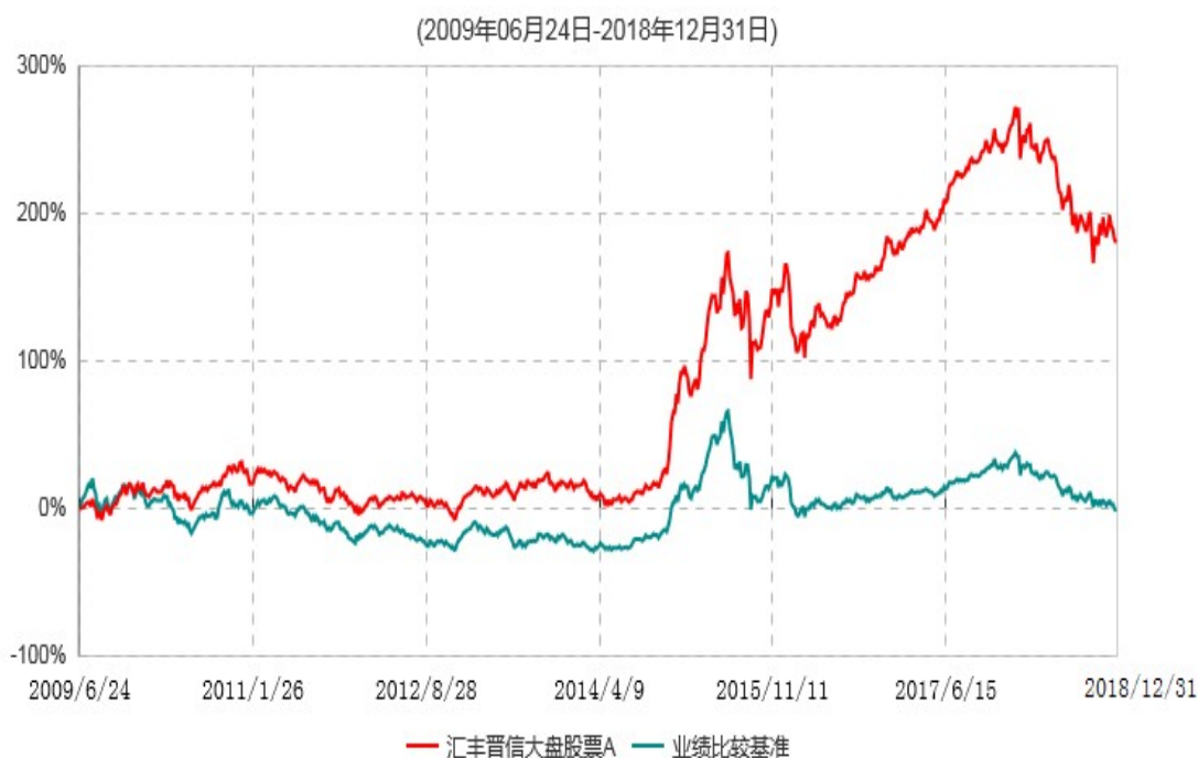
汇丰晋信大盘股票A累计净值增长率与业绩比较基准收益率历史走势对比图

注： 1. 按照基金合同的约定，本基金的股票投资比例范围为基金资产的 85%-95%，其中，本基金将不低于 80% 的股票资产投资于国内 A 股市场上具有盈利持续稳定增长、价值低估、且在各行各业中具有领先地位的大盘蓝筹股票。本基金固定收益类证券和现金投资比例范围为基金资产的 5%-15%，其中现金（不包括结算备付金、存出保证金、应收申购款等）或到期日在一年以内的政府债券的投资比例不低于基金资产净值的 5%。按照基金合同的约定，本基金自基金合同生效日起不超过 6 个月内完成建仓，截止 2009 年 12 月 24 日，本基金的各项投资比例已达到基金合同约定的比例。 2. 报告期内本基金的业绩比较基准= 沪深 300 指数*90% + 同业存款利率*10%。 3. 上述基金