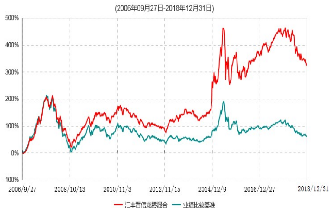
汇丰晋信龙腾混合型证券投资基金累计净值增长率与业绩比较基准收益率历史走势对比图