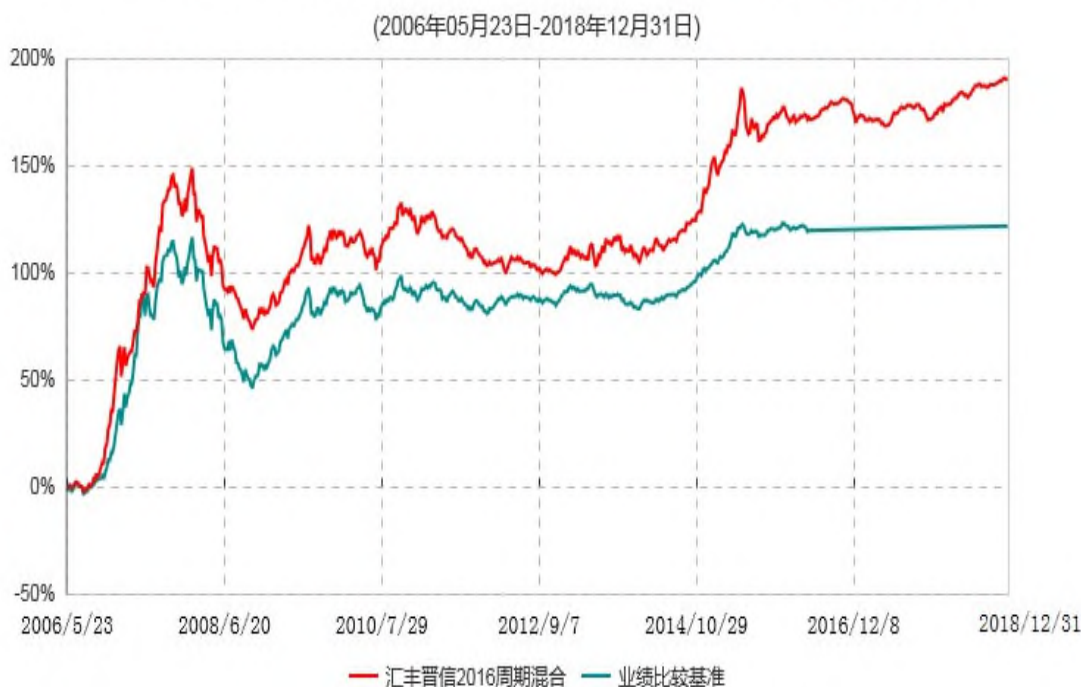
汇丰晋信2016生命周期开放式证券投资基金累计净值增长率与业绩比较基准收益率历史走势对比图