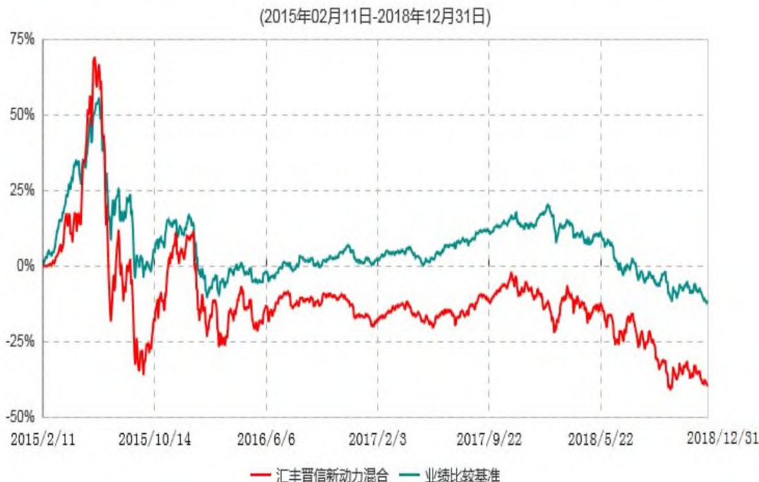
汇丰晋信新动力混合型证券投资基金累计净值增长率与业绩比较基准收益率历史走势对比图