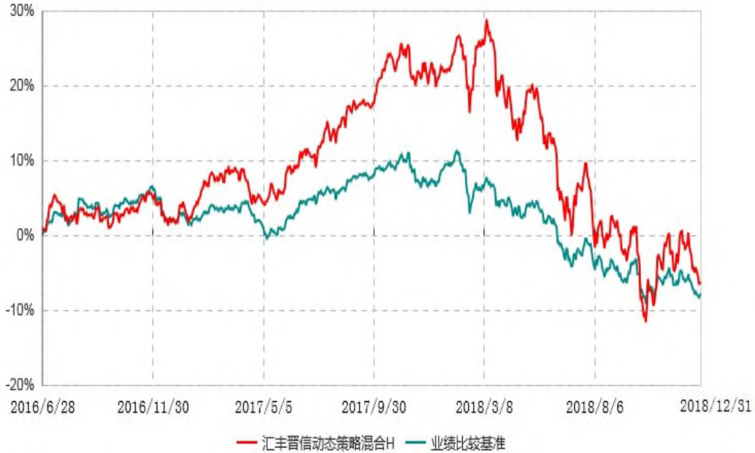
汇丰晋信动态策略混合H累计净值增长率与业绩比较基准收益率历史走势对比图 (2016年06月28日-2018年12月31日)

注： 1. 按照基金合同的约定，本基金的投资组合比例为：股票占基金资产的 30%-95%；除股票以外的其他资产占基金资产的 5%-70%，其中现金（不包括结算备付金、存出保证金、应收申购款等）或到期日在一年期以内的政府债券的比例合计不低于基金资产净值的 5%。 2. 本基金的业绩比较基准为“50%×MSCI 中国 A 股在岸指数收益率+50%×中债新综合指数收益率（全价）”。MSCI 中国 A 股在岸指数成份股在报告期产生的股票红利收益已计入指数收益率的计算中。 3. 自 2018 年 3 月 1 日起，MSCI 中国 A 股指数更名为 MSCI 中国 A 股在岸指数。 4. 本基金自 2016 年 6 月 28 日起增加 H 类份额。