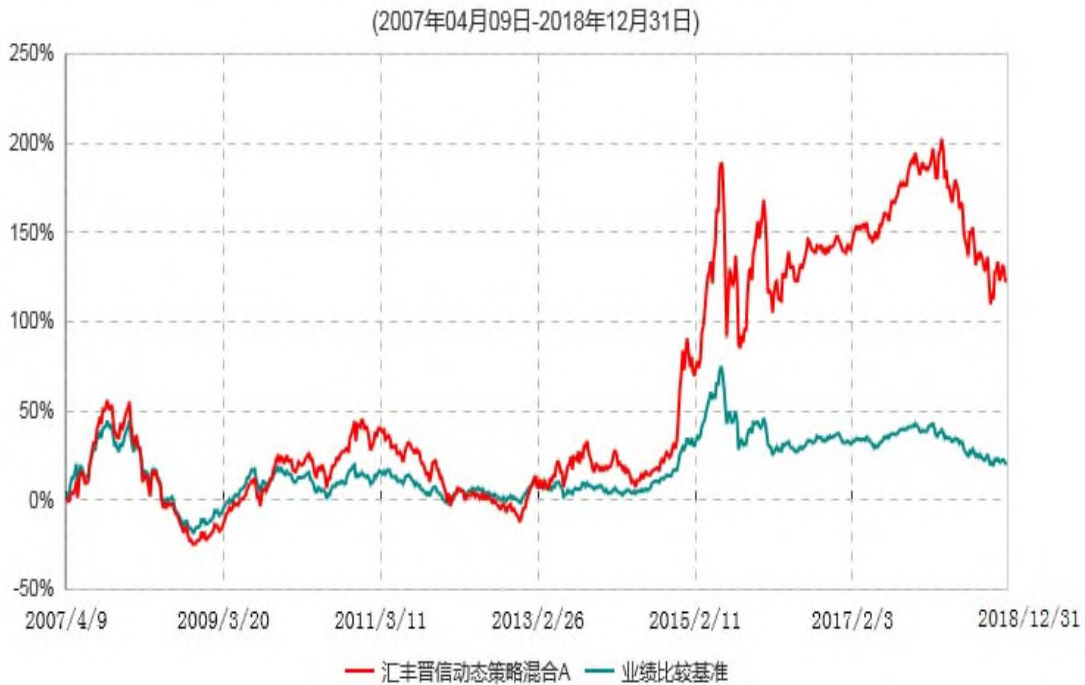
汇丰晋信动态策略混合A累计净值增长率与业绩比较基准收益率历史走势对比图

注： 1. 按照基金合同的约定，本基金的投资组合比例为：股票占基金资产的 30%-95%；除股票以外的其他资产占基金资产的 5%-70%，其中现金（不包括结算备付金、存出保证金、应收申购款等）或到期日在一年期以内的政府债券的比例合计不低于基金资产净值的 5%。本基金自基金合同生效日起不超过六个月内完成建仓。截止 2007 年 10 月 9 日，本基金的各项投资比例已达到基金合同约定的比例。 2. 基金合同生效日（2007 年 4 月 9 日）至 2014 年 5 月 31 日，本基金的业绩比较基准为“50%×MSCI 中国 A 股在岸指数收益率+50%×中信标普全债指数收益率”。自 2014 年 6 月 1 日起，本基金的业绩比较基准调整为“50%×MSCI 中国 A 股在岸指数收益率+50%×中债新综合指数收益率（全价）”。MSCI 中国 A 股在岸指数成份股在报告期产生的股票红利收益已计入指数收益率的计算中。 3. 自 2018 年 3 月 1 日起，MSCI 中国 A 股指数更名为 MSCI 中国 A 股在岸指数。