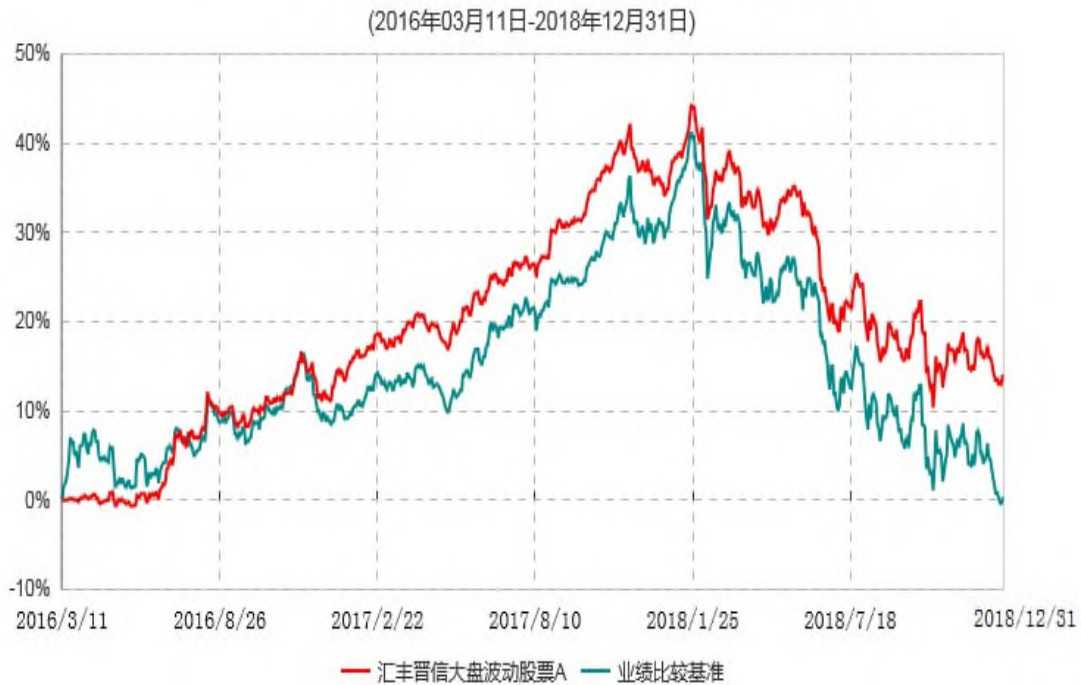
汇丰晋信大盘波动股票A累计净值增长率与业绩比较基准收益率历史走势对比图

注：1. 按照基金合同的约定，本基金的投资组合比例为：基金的投资组合比例为：股票投资比例范围为基金资产的 80%-95%，除股票以外的其他资产投资比例为 5%-20%，权证投资比例范围为基金资产净值的 0%-3%，现金（不包括结算备付金、存出保证金、应收申购款等）或到期日在一年以内的政府债券的投资比例不低于基金资产净值的 5%。本基金主要使用个股优选策略及波动率优化策略构建投资组合，本基金投资于前述“个股优选策略及波动率优化策略”精选的股票不低于非现金基金资产的 80%。本基金自基金合同生效日起不超过六个月内完成建仓。截止 2016 年 9 月 12 日，本基金的各项投资比例已达到基金合同约定的比例。