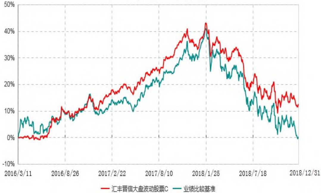
汇丰晋信大盘波动股票C累计净值增长率与业绩比较基准收益率历史走势对比图 (2016年03月11日-2018年12月31日)

注：1. 按照基金合同的约定，本基金的投资组合比例为：基金的投资组合比例为：股票投资比例范围为基金资产的 80%–95%，除股票以外的其他资产投资比例为 5%–20%，权证投资比例范围为基金资产净值的 0%–3%，现金（不包括结算备付金、存出保证金、应收申购款等）或到期日在一年以内的政府债券的投资比例不低于基金资产净值的 5%。本基金主要使用个股优选策略及波动率优化策略构建投资组合，本基金投资于前述“个股优选策略及波动率优化策略”精选的股票不低于非现金基金资产的 80%。本基金自基金合同生效日起不超过六个月内完成建仓。截止 2016 年 9 月 12 日，本基金的各项投资比例已达到基金合同约定的比例。