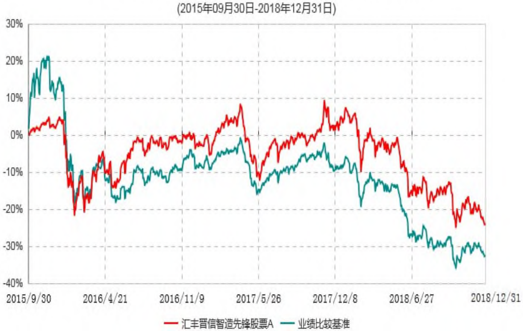
汇丰晋信智造先锋股票A累计净值增长率与业绩比较基准收益率历史走势对比图