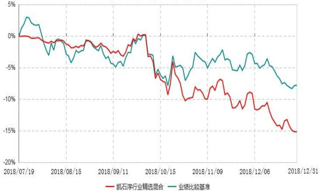
凯石淳行业精选混合型证券投资基金累计净值增长率与业绩比较基准收益率历史走势对比图 (2018年07月19日-2018年12月31日)