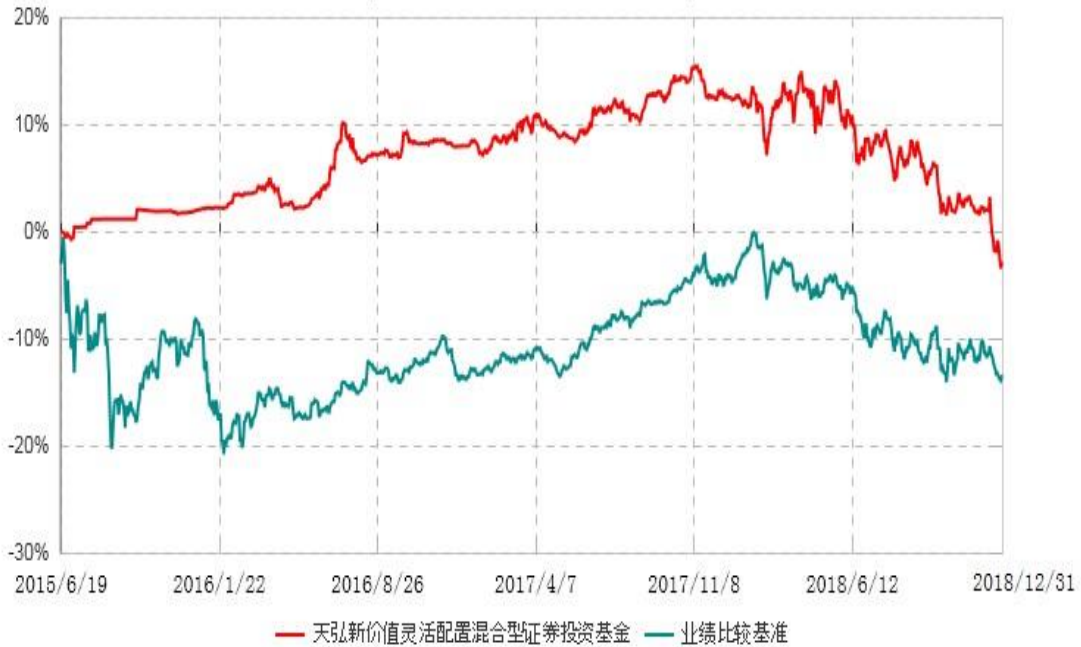
天弘新价值灵活配置混合型证券投资基金累计净值增长率与业绩比较基准收益率历史走势对比图 (2015年06月19日-2018年12月31日)