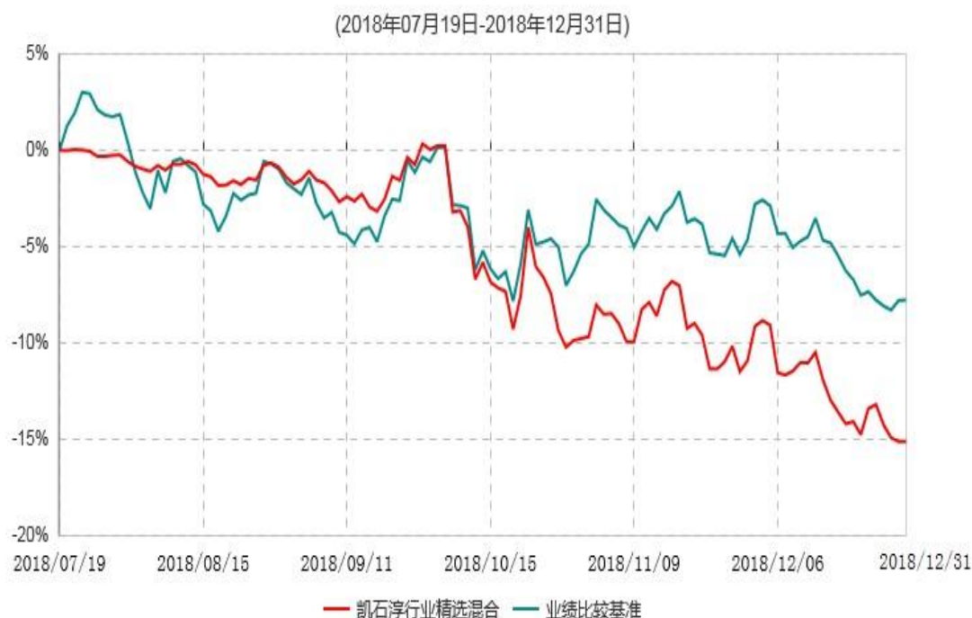
凯石淳行业精选混合型证券投资基金累计净值增长率与业绩比较基准收益率历史走势对比图

注：1、本基金于2018年7月19日成立，自合同生效起至本报告期末不满一年。 2、本基金建仓期6个月，截至本报告期末建仓期尚未结束。