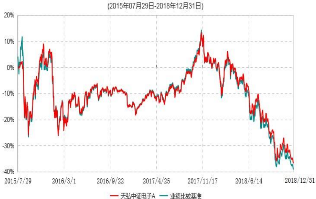
天弘中证电子A累计净值增长率与业绩比较基准收益率历史走势对比图