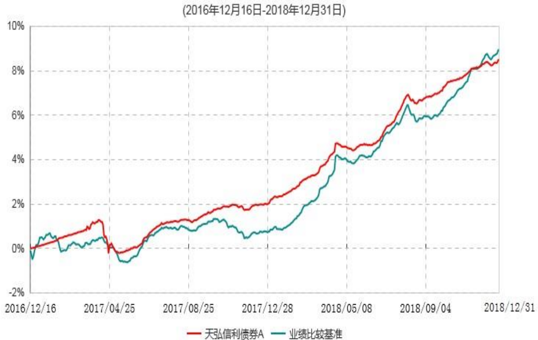
天弘信利债券A累计净值增长率与业绩比较基准收益率历史走势对比图