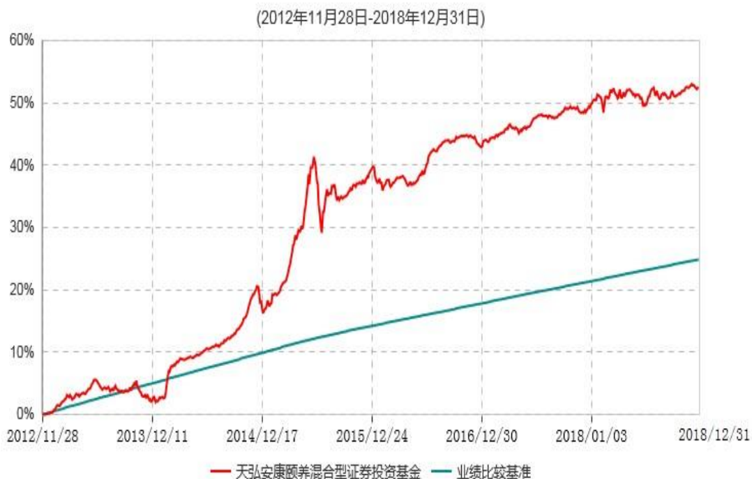
天弘安康颐养混合型证券投资基金累计净值增长率与业绩比较基准收益率历史走势对比图