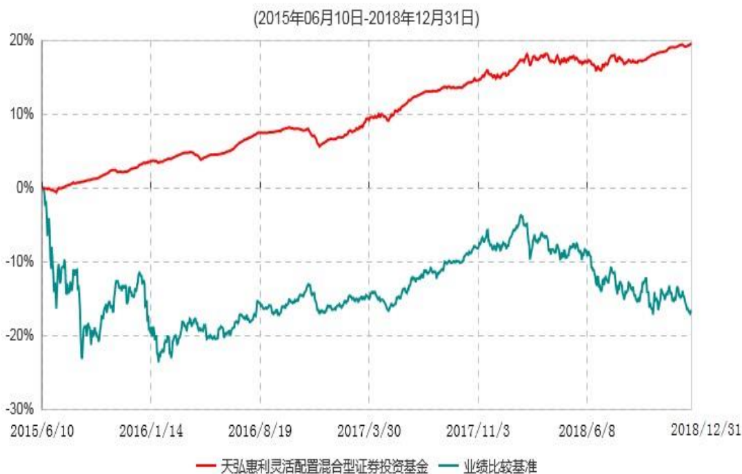
天弘惠利灵活配置混合型证券投资基金累计净值增长率与业绩比较基准收益率历史走势对比图