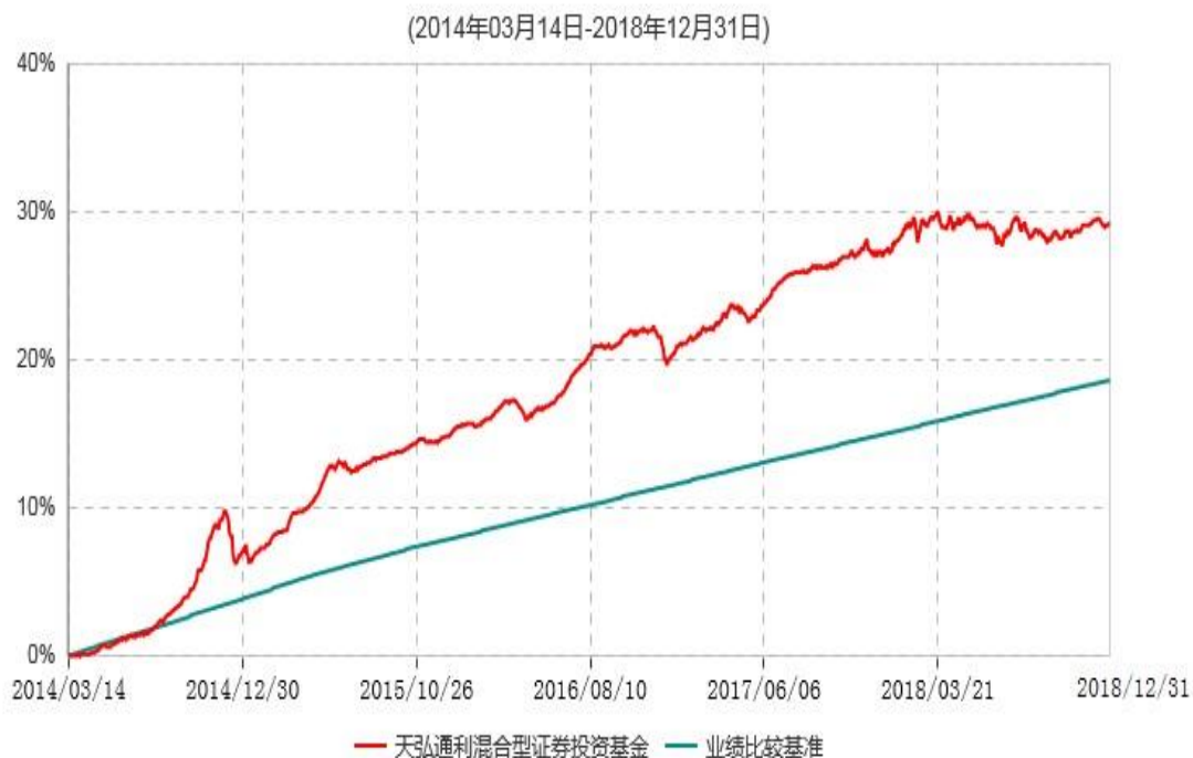
天弘通利混合型证券投资基金累计净值增长率与业绩比较基准收益率历史走势对比图