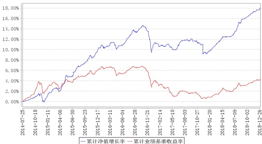
南方启元债券A累计净值增长率与同期业绩比较基准收益率的历史走势对比图