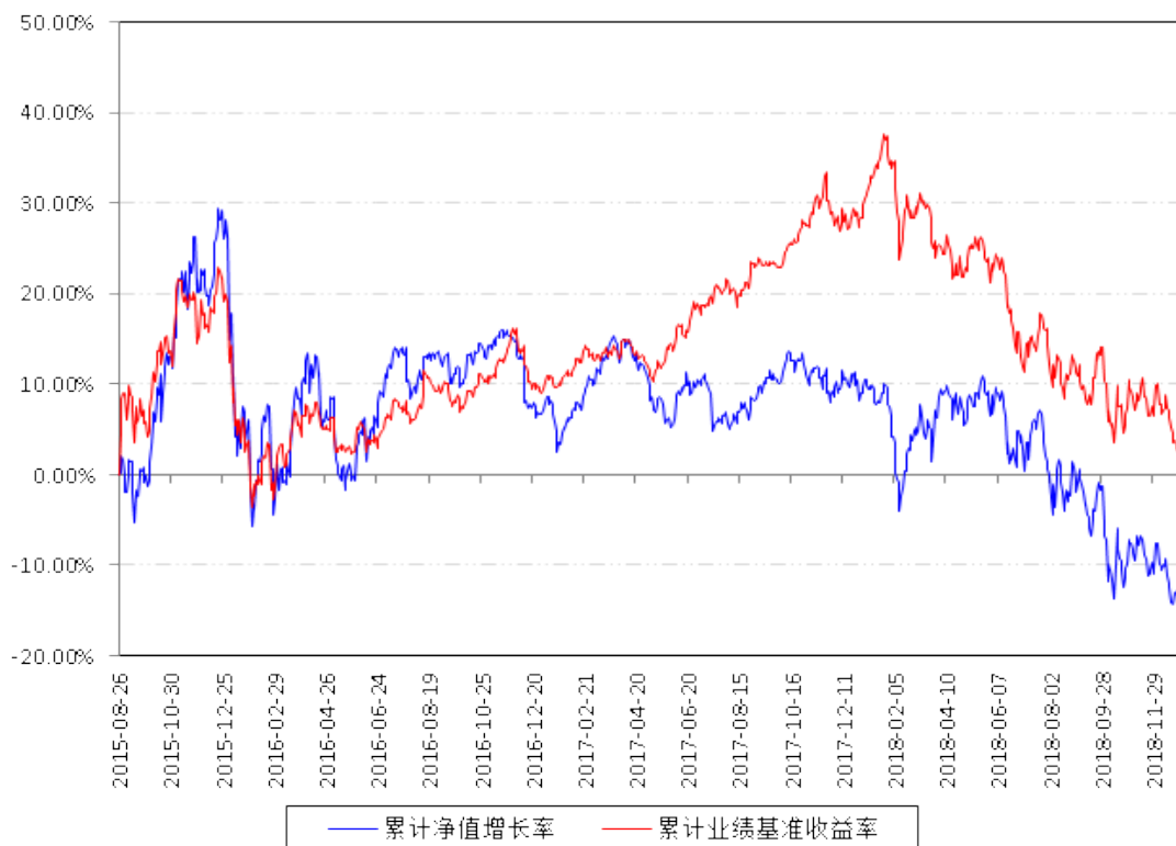
南方国策动力股票累计净值增长率与同期业绩比较基准收益率的历史走势对比图