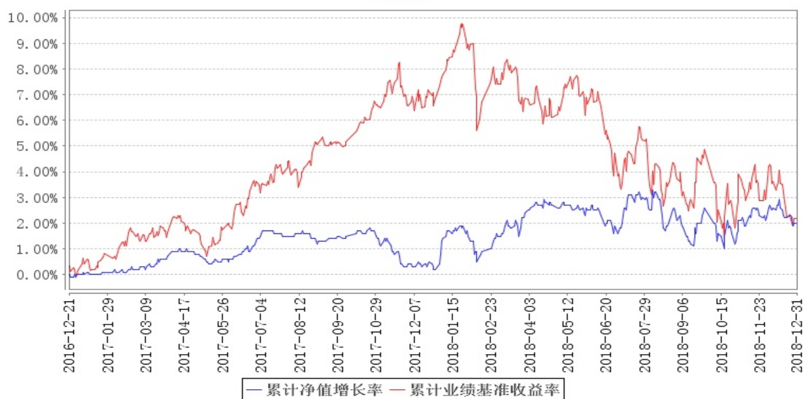
南方睿见定期开放混合发起累计净值增长率与同期业绩比较基准收益率的历史走势对比图