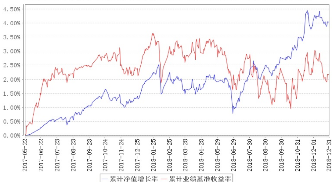
南方荣尊A累计净值增长率与同期业绩比较基准收益率的历史走势对比图