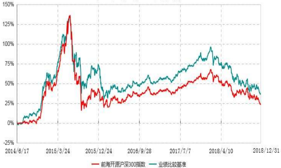
前海开源沪深300指数型证券投资基金累计净值增长率与业绩比较基准收益率历史走势对比图 (2014年06月17日-2018年12月31日)