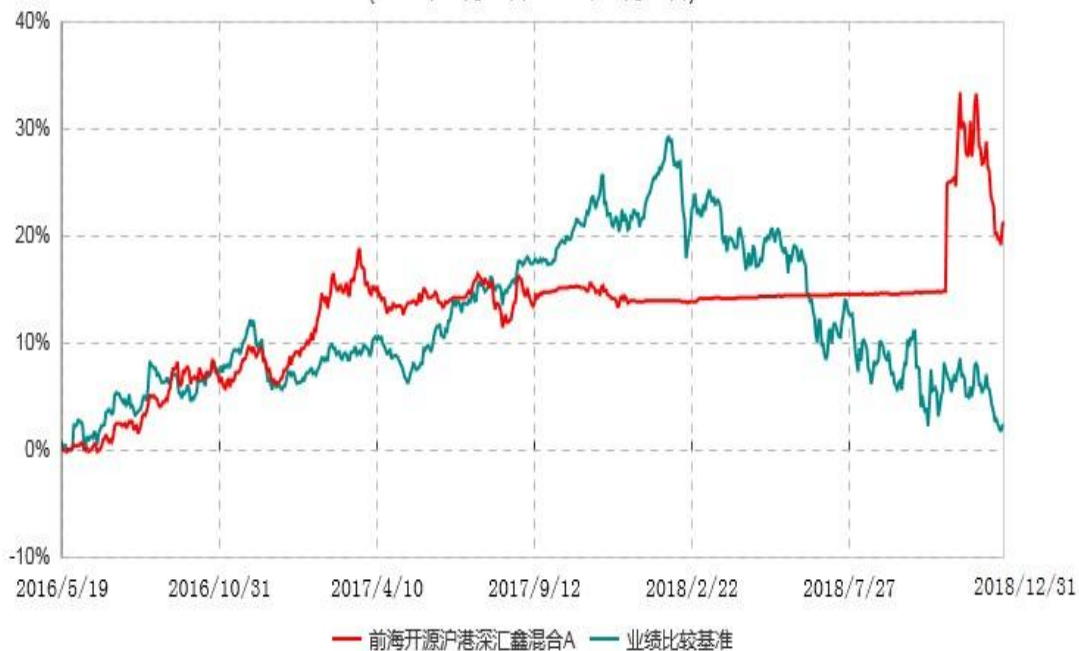
前海开源沪港深汇鑫混合C累计净值增长率与业绩比较基准收益率历史走势对比图